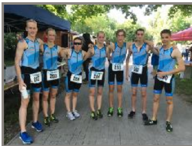
Unsere TriaKids nach einem Wettkampf

Schriftf.: Michael Drieschner, Polizeibeamter